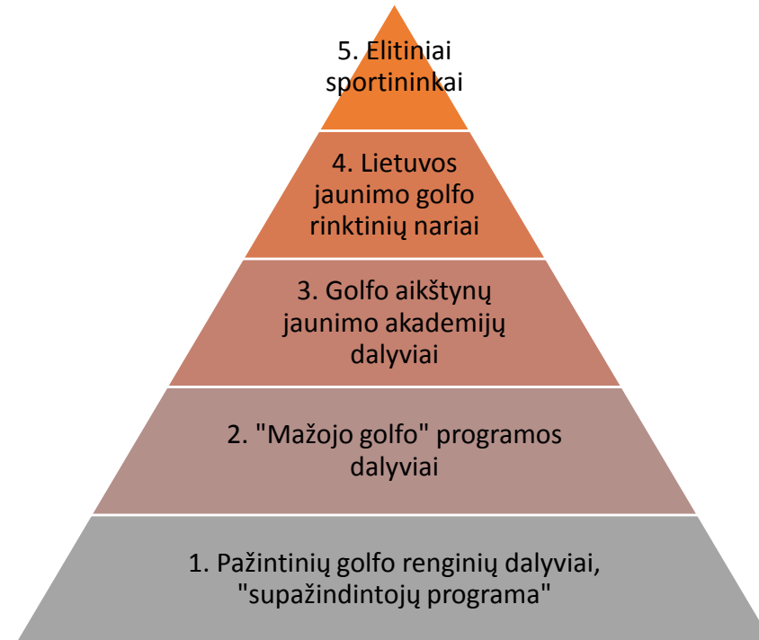
2 pav. Jaunimo programos dalyvių piramidė

Prie strateginių veiklų etapų įgyvendinimo prisidės PGA LTU, Golfo žaidėjų asociacija, Lietuvos golfo aikštynai ir Lietuvos golfo federacija. Taip bus užtikrintas bendrų tikslų siekimas, skatinant bendradarbiavimą.